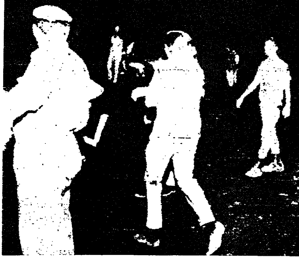
صورة خاصة بالدستور من اليونانديرس تبين بعض رجال الشرطة الاسرائيليين وهم يفتقون الطرق والابواب المؤدية الى البلدة القديمة من القدس ليلة الأحد الماضي .

قتيلان وجريحان من جنود العدو تل ابيب - رويتر - أعلن هنا ان جنديا اسرائيليا واحدا قتل واصيب جنديان اخران بجروح عندما اصطدمت سارة مصفحة كانوا فيها بطنم ارضي الى الشرق من بحرة طبريا أمس . وأعلن ايضا ان جنديا اسرائيليا واحدا قتل عندما اصطدمت سيارته بطنم بالقرب من مستعمرة بير منحسا ( بلر الملح ) قبالة الطريق المؤدي الى ايلات .